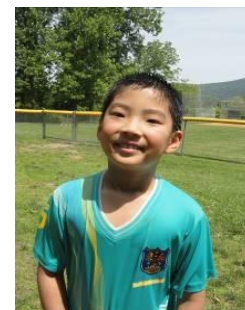
Mr. Shi Junior Represents Senior